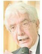
Salvatore Rossi presidente dell'Ivass

Le assicurazioni, mostra la tabella, hanno aumentato il collocamento di prodotti a contenuto finanziario