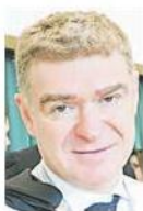
Mario Nava presidente Consob

In estrema sintesi, la Idd introduce anche nel mondo assicurativo i principi e le regole in termini di trasparenza, adeguatezza, conflitti di interesse e product governance già presenti nella Mifid 2. Rispetto alla normativa che regola gli strumenti finanziari non mancano, tuttavia, piccole differenze: gli incentivi, ad esempio, sono ammessi dalla Mifid II solo a condizione che accrescano la qualità del servizio, nella Idd sono consentiti se non hanno alcuna ripercussione negativa sulla qualità del servizio. Ma qualcosa potrebbe cambiare in questo ambito. «Trattandosi di una normativa europea ma non di massima armonizzazione, lo stato membro può avere, se vuo-